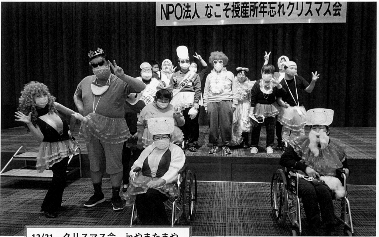
12/21 クリスマス会 inやまたまや